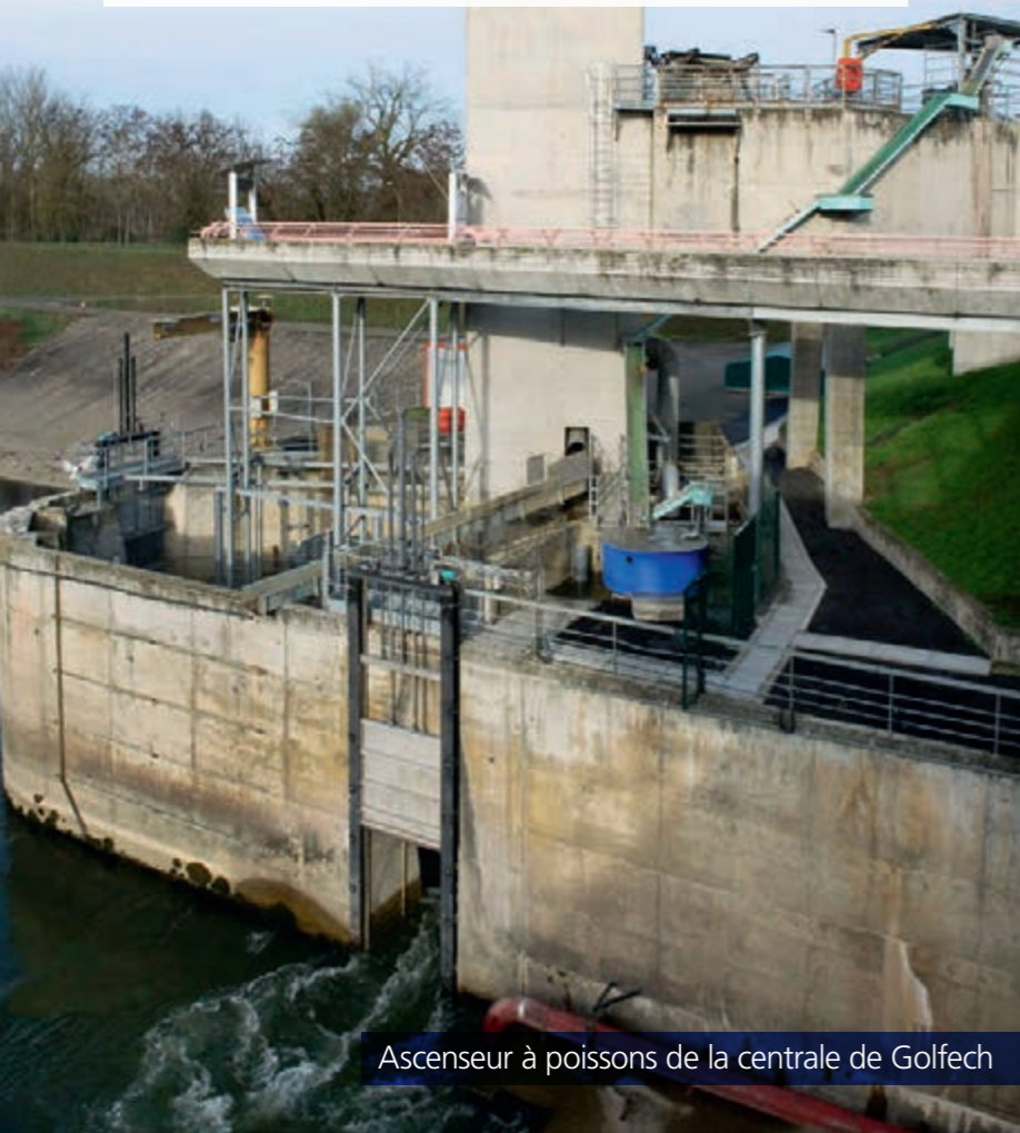
Ascenseur à poissons de la centrale de Golfech