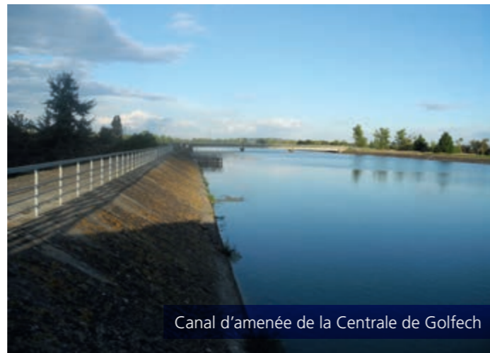
Canal d'amenée de la Centrale de Golfech

Les poissons migrateurs ont de tout temps remonté la Garonne pour se reproduire jusqu'aux eaux fraîches du pied des Pyrénées ou des contreforts du Massif-Central. Leur long voyage vers les frayères passe par Golfech. L'ascenseur à poissons de Golfech, créé en 1987, leur ouvre ainsi la route vers les bassins versants amonts de l'Aveyron, de la Garonne et du Tarn.