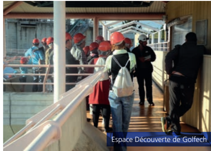
Espace Découverte de Golfech